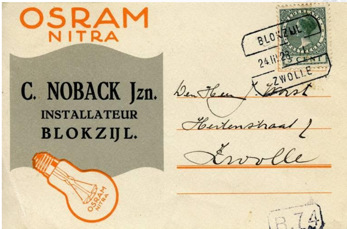
Blokzijl, 24 maart 1928. Bestemming Zwolle. Voorbeeld van een bijgedrukt adres van de installateur/verkoper van Osram producten, op een door Osram verstrekte briefkaart. Tramstempel Blokzijl-Zwolle.