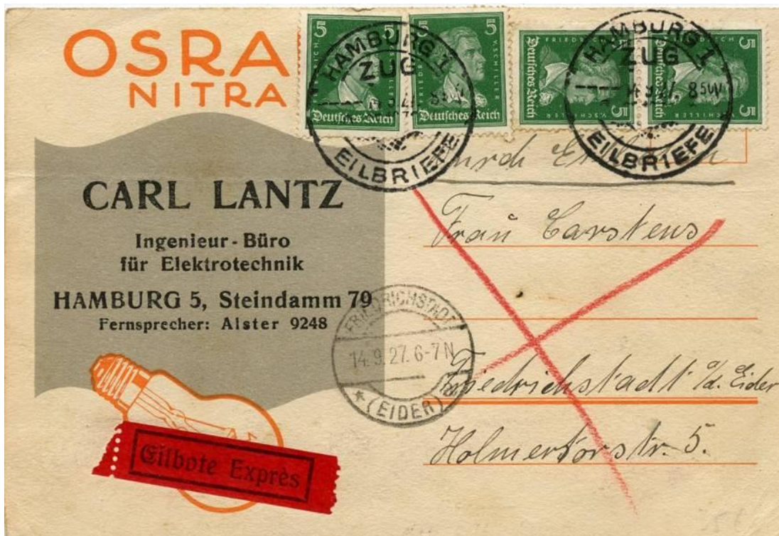
Hamburg, 14 september 1927. Bestemming Friedrichstadt a/d Eider. Per expres verstuurd, stempel Hamburg-ZUG-Eilbriefe.