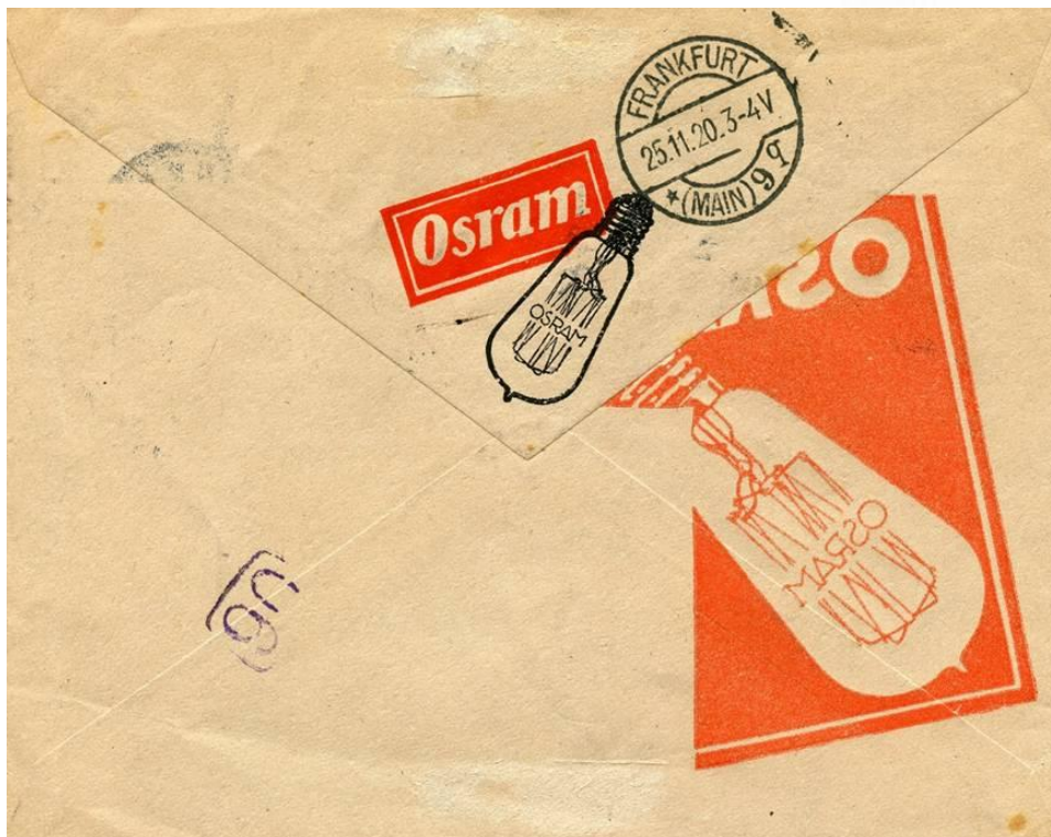
Kopie achterzijde met gevarieerde opdrukken Osram.