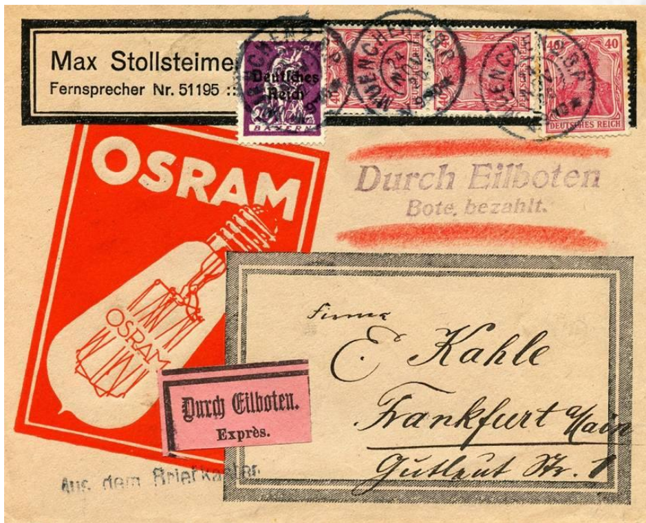
München, 24 november 1920. Bestemming Frankfurt am Main. Per expres, mengfranking met opdrukzegels Deutsches Reich op Bayern postzegel.